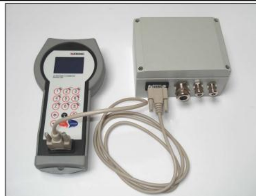
KATflow 100 без дисплея и инструмент установки