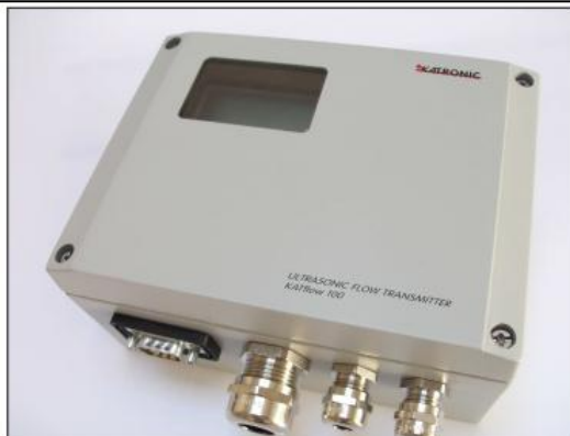
KATflow 100 с дисплеем