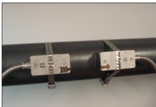
Крепление преобразователей при помощи лент и зажимов